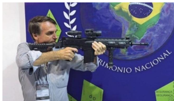
Jair Bolsonaro desplegó una campaña que una y otra vez invocaba el uso de las armas, la criminalización de la protesta e incluso “fusilar” a opositores.

De ese modo, Brasil devino en el mayor extractivista del continente, tanto minero como agropecuario (por ejemplo, las exportaciones de minerales hasta llegaron a triplicar a la suma de todos los demás países mineros sudamericanos). Esto sólo es posible aceptando una inserción subordinada en el comercio global y una acción limitada del Estado en algunos sectores como el industrial, justamente al contrario de las aspiraciones de la izquierda de sacar a nuestros países de esa dependencia en la exportación de productos primarios.