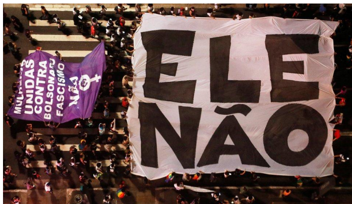
Protesta contra Bolsonaro que resultó ser la mayor movilización de mujeres en la historia de Brasil. En la foto la protesta callejera en São Paulo (setiembre 2018).

Cuestionamientos sobre temas fundamentales como los impactos del “nuevo desarrollismo” primarizado fueron no sólo desatendidos, sino que además se combatieron los debates y se marginaron los ensayos que buscaban las alternativas al desarrollo. Persistían problemas como el debilitamiento en la cobertura de derechos, la violencia en el campo y la ciudades, el destrato de los pueblos indígenas, y todo tipo de impactos ambientales. Pero distintos actores, tanto dentro de esos países como desde el exterior, aplaudían complacientes incapaces de escuchar las voces de alarma con el pretexto perverso de ser funcionales a la oposición.