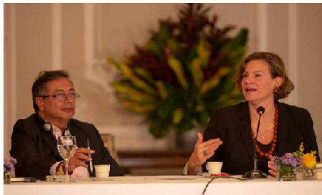
Gustavo Petro, presidente de Colombia y M. Mazzucato en Bogotá.

A mediados de la década de 1950 ya se ensayaban procedimientos que en aquellos años eran llamados de “programación”, e incluso se discutía sobre como incidir en la “velocidad” del crecimiento económico como en su “dirección”. Para dejar atrás lo que se describía como “subdesarrollado”, se sostenía que la planificación era indispensable para no quedar atrapados por