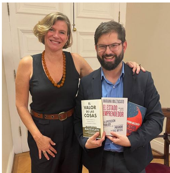
Gabriel Boric, presidente de Chile, con M. Mazzucato en La Moneda, Santiago, octubre 2022.

A partir de ese tipo de discusiones se sostiene que es posible repensar el capitalismo a partir de tres aspectos básicos. El primero concibe a los mercados como un emergente de las interacciones entre actores económicos e instituciones, tanto públicas como privadas, que a su vez están enmarcadas en estructuras sociales, legales y culturales. No existen mercados “universales” ni “naturales”.